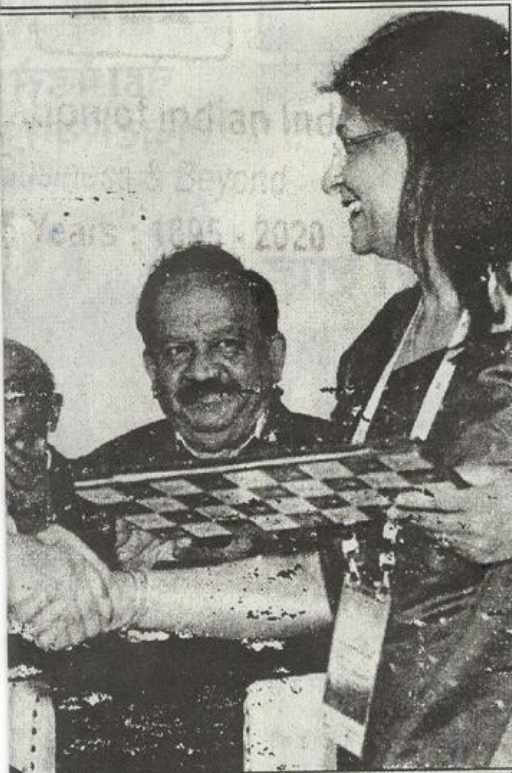
और प्रौद्योगिकी और पृथ्वी विज्ञान मंत्री, डॉ. हर्षवर्धन नई दिल्ली में और ससाकावा-इंडिया लेप्रोसी फाउंडेशन के बीच एक समझौता ज्ञापन

कम होने के कारण मरीजों को नी का सामना करना पड़ता है। बठन का सुविधा होगा साथ ही इसमें एक माइनर ऑपरेशन थिएटर भी बनाया गया है।