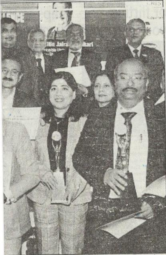
transport & Highways and Micro, Small & Medium Enterprises, members of the ASSOCHAM's 7th MSMEs Excellence Awards, at

70-member Delhi Assembly will go to polls on February 3 and the results will be announced on February 11.